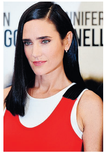
NEL CAST Jennifer Connelly

Dal 25 su Netflix, ispirata a «Parasite» di Bong Joon-ho