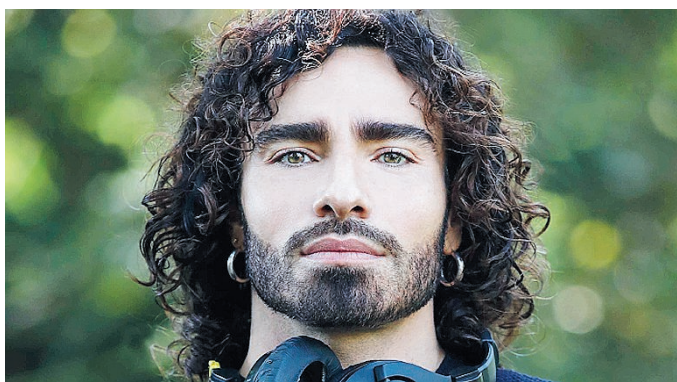
REGISTA Carlo Fenizi di Foggia

Laureato alla Sapienza di Roma in Lettere e Filosofia con lode, seconda laurea in Interpretazione e Traduzione in lingua spagnola all'Università degli Studi Internazionali di Roma, studi di regia a Firenze e specializzazione in direzione degli attori e nelle tecniche di messa in scena a Cuba, Carlo Fenizi scrive e dirige nel 2008 in Spagna, a 23 anni, il suo primo mediometraggio, il noir "La luce dell'ombra". Nel 2011 firma e dirige il successo "Effetto paradossio" (fra le location c'è Orsara), con Cloris Brosca, nel 2013 è la volta di "Quando si muore...", film del genere commedia con Giacomo Rizzo, Francesco Paolantoni e Maurizio Mattioli per il mercato televisivo estero: l'opera gli vale il prestigioso premio 5th International Social Commitment Award, sezione giovani talenti, ricevuto a Milano nel 2013. Nel 2017 nuovo importante premio per il cortometraggio "Umbra", miglior film fantastico al White Whale Narrative Festival in Usa. Fenizi ha anche diretto e ideato il video "Non voglio andare via", brano postumo inedito di Giuni Russo, con la partecipazione di Maria Grazia Cucinotta, premiato al Roma Videoclip 2017. Sue grandi passioni (parallele all'attività di docenza di materie audiovisive, linguistiche e storico letterarie), la lingua e la linguistica spagnola e la letteratura ispano-americana